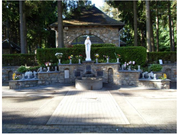
Afb. 4 De bron

het Latijn op staat: “Jezus Christus is de enige bron, en Maria opent ons de toegang.” Op het bekken waarin de pelgrim zijn handen kan steken, staat in het Frans geschreven: “Was uw handen in het water.” Aan beide zijden van het monument zijn kraantjes te vinden om flesjes te kunnen vullen met het water uit de bron. Er zijn bankjes geplaatst aan de overzijde van de weg, recht tegenover de bron, om pelgrims de mogelijkheid te bieden te gaan zitten en in stilte naar de bron te kijken.