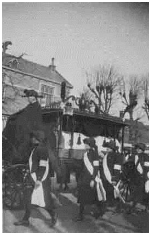
Begravenis van Nellie van Kol, 1930.