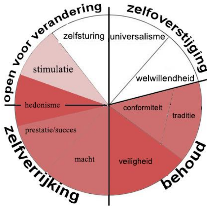
Figuur 3. Waarden Turks gezin

Wat als eerste opvalt is dat mijn informanten veel meer spreiding hadden in de waarden die ze toekenden aan de opvoeding van een gemiddeld Turks gezin. Waar ze voor hun eigen opvoeding voornamelijk veiligheid, conformiteit, traditie en welwillendheid kozen, zien we nu ook dat ook het linkerdeel van de cirkel rood is gekleurd.