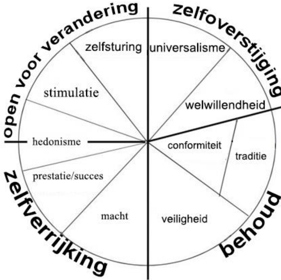
Figuur 1. Schwartz' waardencirkel (vertaald)

Het totale patroon van relaties van de waarden, gekeken naar conflict en compatibiliteit tussen de waarden, geeft een structuur van waardesystemen. Om deze relaties te verduidelijken heeft Schwartz een cirkel opgesteld (Schwartz, 2012):