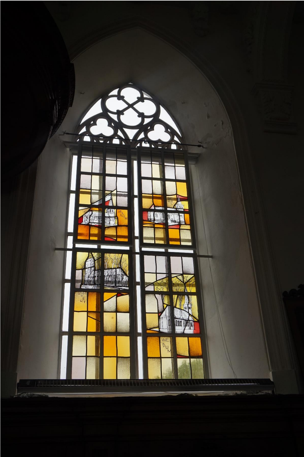
Figuur 1: Ramen