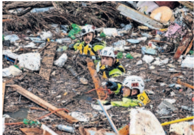
PERRY COUNTY

■ Het aantal doden als gevolg van de overstromingen in de Amerikaanse staat Kentucky is opgelopen tot 35. Gouverneur Andy Beshear liet maandag weten dat er onder de doden vier kinderen zijn. Ook waarschuwde hij dat er nog meer