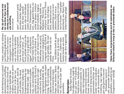
Tijdens Peper's burgemeesterschap werd de wederopbouw van Rotterdam ruimgesteurd en kreeg de stad zijn grootste succes.

Wie is Bram Peper? Peper was een van de meest spraakmakende politici van de afgelopen jaren. Hij was een persoon met een uitgesproken karakter, die niet schroomde om zijn mening over zichzelf en over anderen kenbaar te maken. Hij was een succesvolle burgemeester van Rotterdam en voormalig minister. Hij stond bekend als een charmante, grappige en soms roegloze politicus.