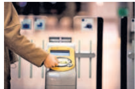
▲ OVpay kan dit jaar door softwareproblemen nog niet landelijk worden uitgerold.

Hulp invoeren van elders heeft weinig zin, denkt Van Weele. Nieuwe openbaarvervoerssystemen in het buitenland zijn vooral ingericht op gebruik door reizigers in één stad. „Bij ons kun je straks gewoon in een heel land van dezelfde betaalmethode gebruikmaken en overstappen tussen alle vervoerders. De complexiteit is wat dat betreft van een andere orde. Wat wij hier uitrollen, daar zijn we als Nederland redelijk uniek in. Echt wereldwijd een voorloper.”