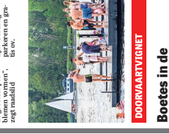
AMSTERDAM • Veel bootgebruikers lijken nog niet op de hoogte dat er een nieuw beleid is.

AMSTERDAM • De fractie van de FvdV wil dat de gemeente Amsterdam sneller een woning vindt voor de Jeraar. De fractie van de FvdV wil dat de gemeente Amsterdam sneller een woning vindt voor de Jeraar.