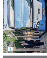
AMSTERDAM • Veel bootgebruikers lijken nog niet op de hoogte dat er een nieuw beleid is.

De politie heeft de noodkreet overgeleverd aan de politie. Het politiekorps heeft de noodkreet overgeleverd aan de politie. Het politiekorps heeft de noodkreet overgeleverd aan de politie.