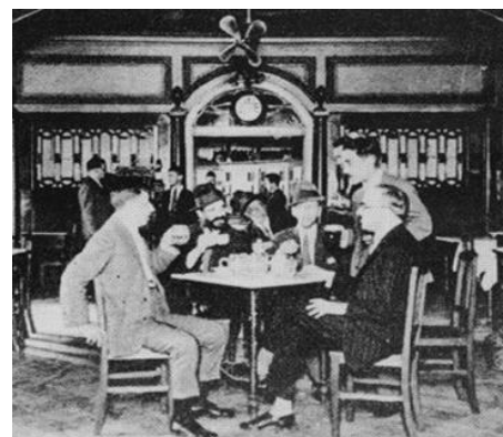
Fernando Pessoa (rechts) zit aan een ontbijttafel in een café in Lissabon

Op het eerste gezicht springt er wat betreft de levensloop van Pessoa weinig karakteristieks in het oog. Toch is hij beroemd geworden om vele karakters die hij in zichzelf verenigde. Pessoa's werk kenmerkt zich door de vele personen onder wiens naam hij geschreven heeft. In sommige gevallen ging het enkel om namen, in andere gevallen om hele uitgewerkte personages inclusief horoscopen en biografieën. Zelf zegt hij daarover: 'Ik heb van kinds af aan de noodzaak gevoeld om de